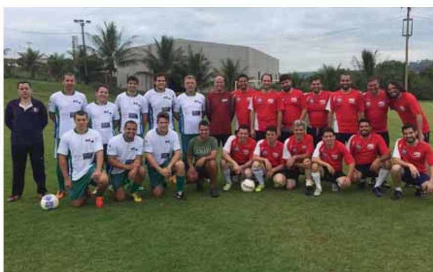
Atletas que participaram desta partida (time da AEASC de vermelho)