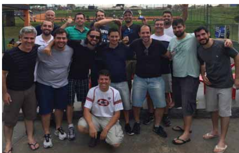
Atletas após partida, com o presidente da AEAARP (ao fundo, de azul escuro, sem boné).