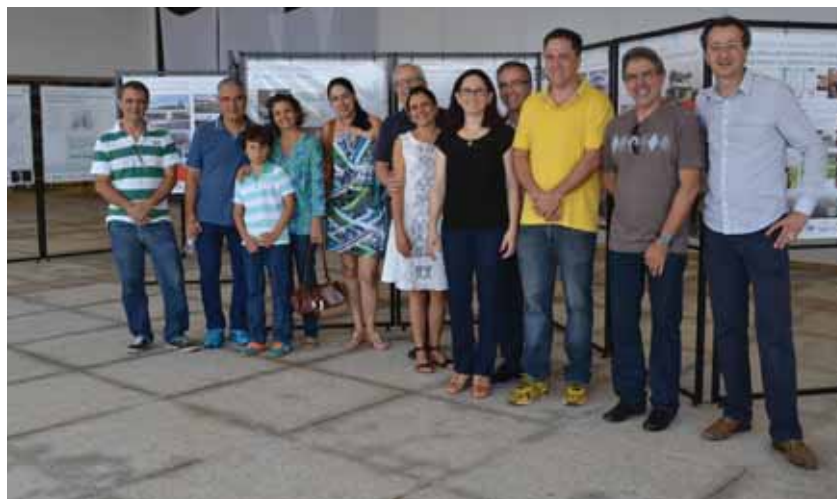
Exposição da I Mostra de Arquitetura já no Passeio de São Carlos