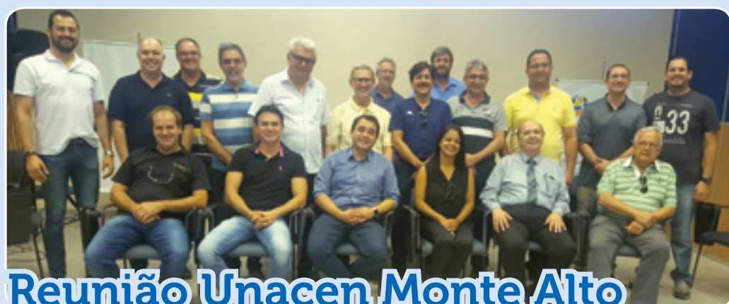
Reunião Unacen Monte Alto

-aula, transferências de outros países ou estados, cancelamento de multas, interrupção de registros, divergências em obras ou serviços, fornecimento de atestados, além de ser o Conselheiro representante da AEASC", explica o engenheiro. ■