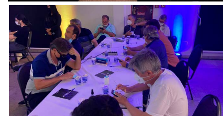
Celulares sendo usados como ferramenta para avaliar e diagnosticar a realidade das cidades