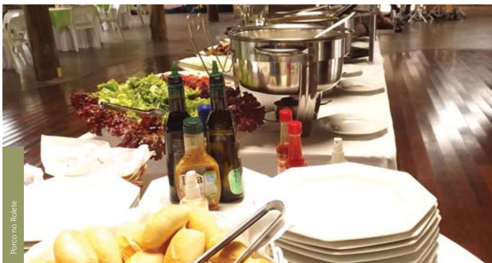
Porco no Roleté