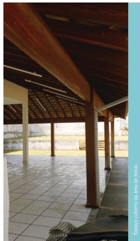
Espaço coberto da área de festas