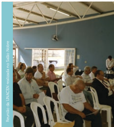
Reunião da UNACEN realizada no Salão Nobre

A AEASC e o Jornal O PROJETO agradecem a disposição para nossa matéria, e na hospitalidade na realização da Reunião da UNACEN e do já próximo Campeonato Esportivo!♦