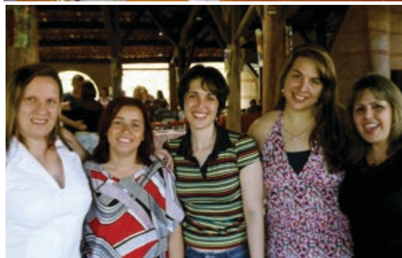
Funcionárias da AEASC e do CREA

Com valor especial de adesão pra quem participar da 7ª SEASC! Enquanto nosso próximo almoço não chega, confira imagens de como foi deliciosa nossa FEIJOENGA! ♦