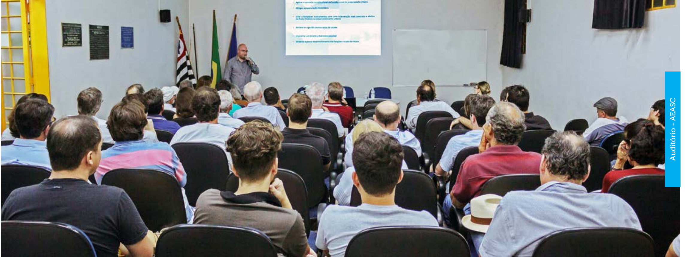
Audatório - AEASC

Palestras sobre o tema estão sendo realizadas na AEASC