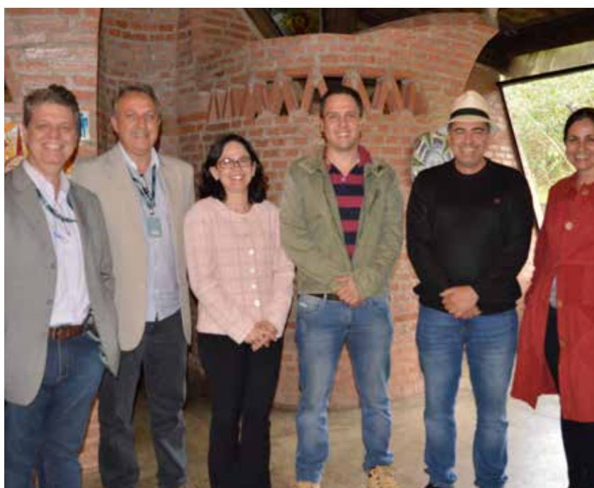
Gerentes do CAU SP no interior, direção da entidade e da AEASC fizeram um esforço conjunto para trazer o CAU Itinerante