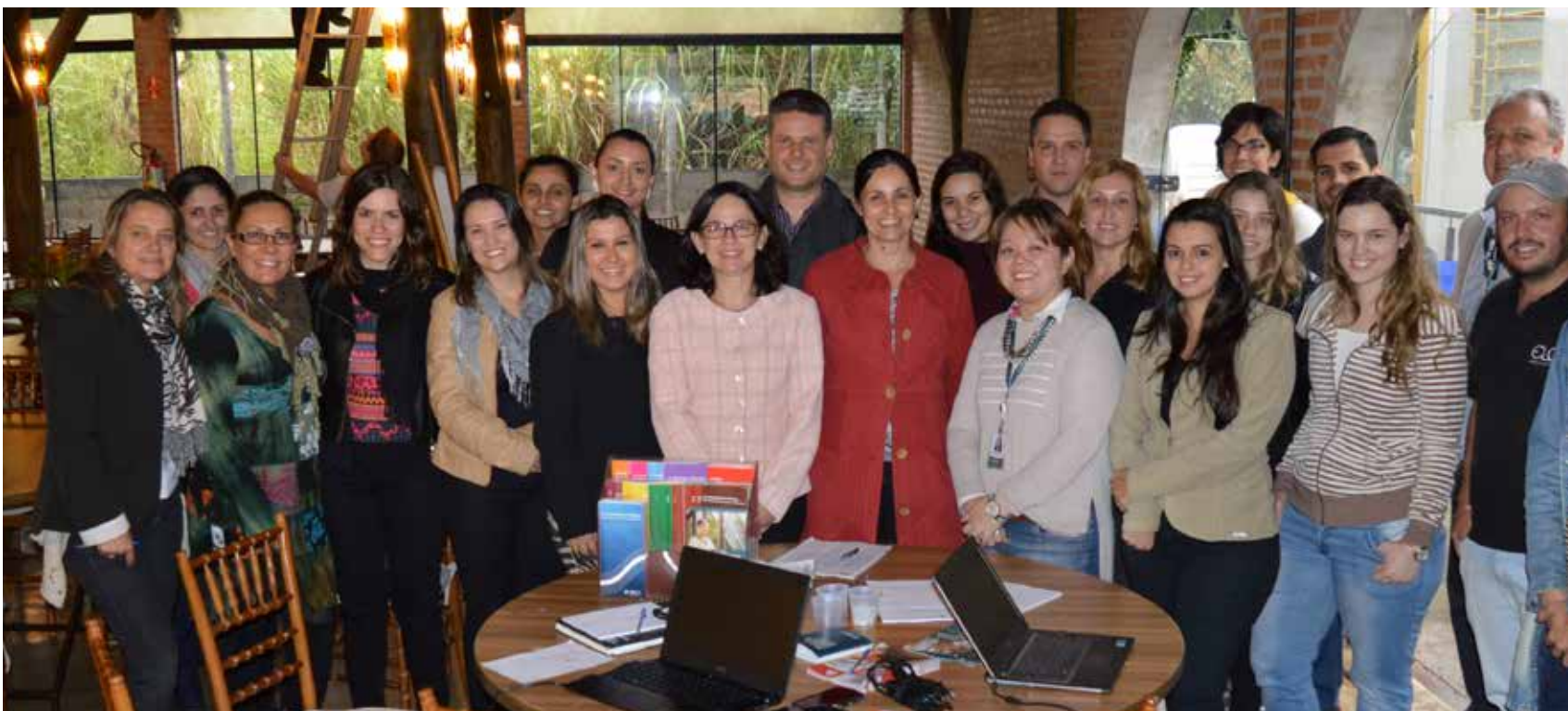
Organizadores, técnicos e participantes fizeram um balanço muito positivo do CAU Itinerante em São Carlos