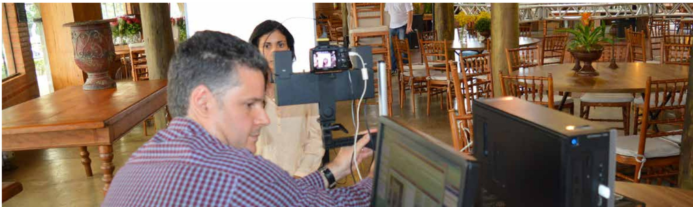
Registro para confecção da identificação do profissional no CAU SP

Entre os serviços disponibilizados nesse dia do CAU Itinerante em São Carlos, houve o curso sobre o SICCAU que capacitou os profissionais para a operação do sistema que inclui a emissão das RRT's (Registro de Responsabilidade Técnica), espaço para pagamento de anuidades e de voto nas eleições do CAU. "Houve uma participação significativa de profissionais no treinamento interes-