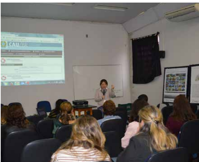
Houve o curso sobre o SICCAU que capacitou os profissionais para a operação do sistema CAU