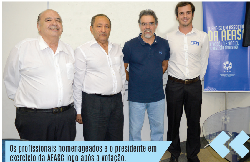
Os profissionais homenageados e o presidente em exercício da AEASC logo após a votação.

Podem concorrer profissionais registrados no CREA (engenheiros, agrônomos, geólogos, geógrafos e meteorologista) ou CAU (arquiteto e urbanista) sendo que os indicados para Profissional do Ano e o Profissional Homenageado não podem ser membros da diretoria em exercício da entidade. A escolha dos nomes acontece em reunião com o colegiado composto pelos diretores, conselheiros e associados da AEASC. São 3 votações por categoria. Na primeira, os associados votam em três nomes indicados previamente. Em seguida, os cinco mais votados vão para uma segunda votação. Nesta, escolhem dois nomes entre os cinco mais votados na primeira apuração. Os dois mais