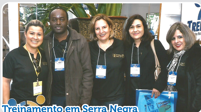
Treinamento em Serra Negra

Termo de cooperação mútua entre Crea-SP e IDP-SP: parceria vai beneficiar profissionais do Sistema e funcionários do Conselho