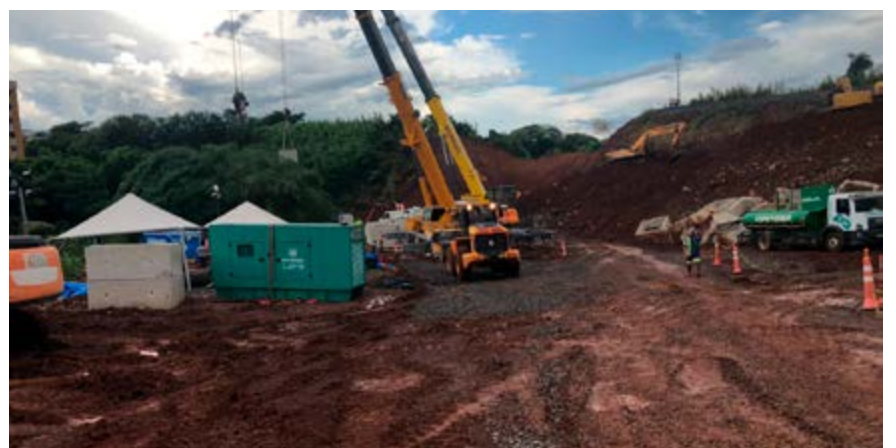
Obras da Rumo quando ainda estavam em fase inicial