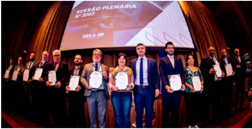
Reunião realizada no início de janeiro com o Poder Executivo